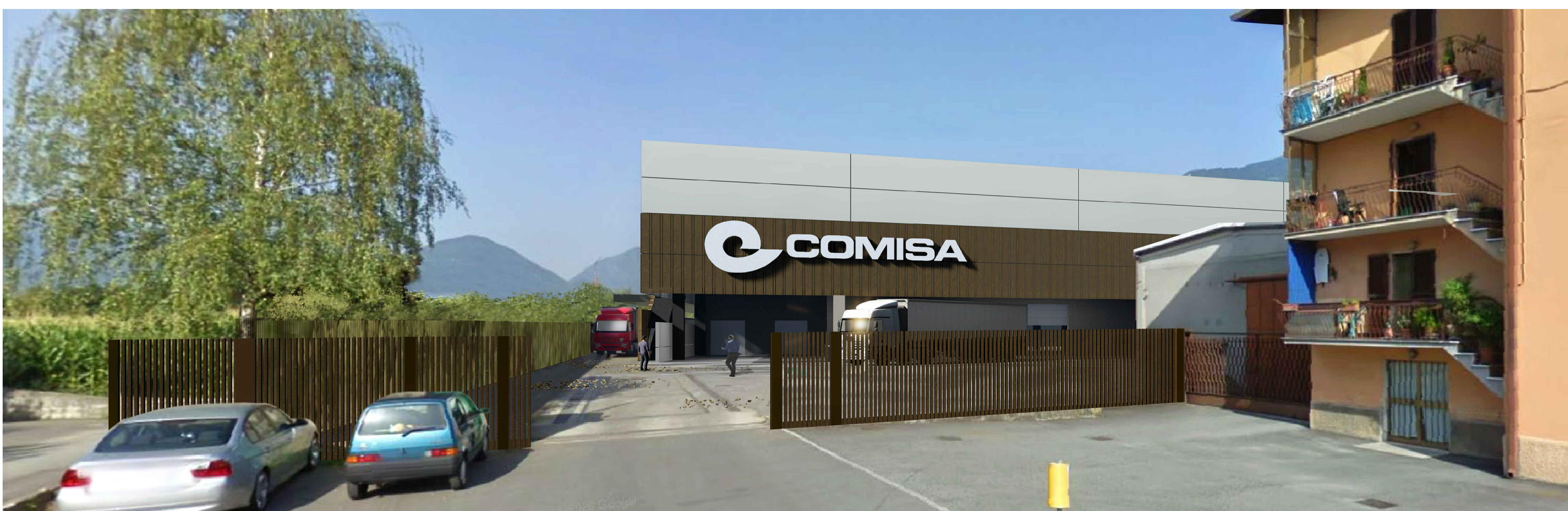
6. VISTA DA STRADA AD EST