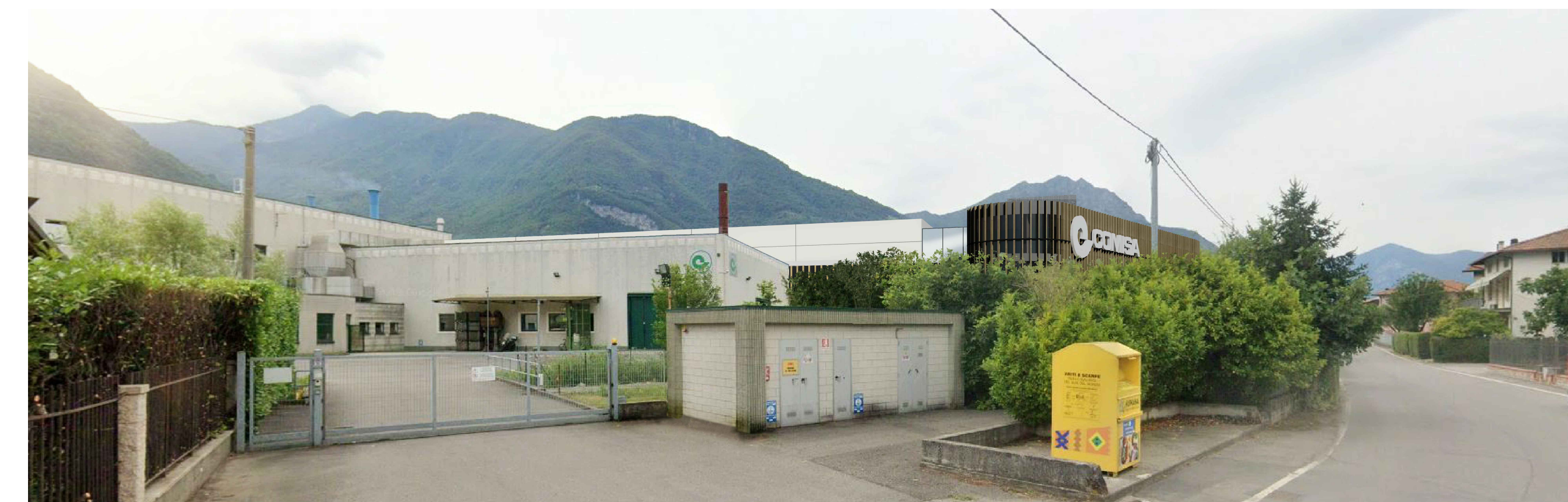
5. VISTA DALL'INGRESSO NORD-OVEST