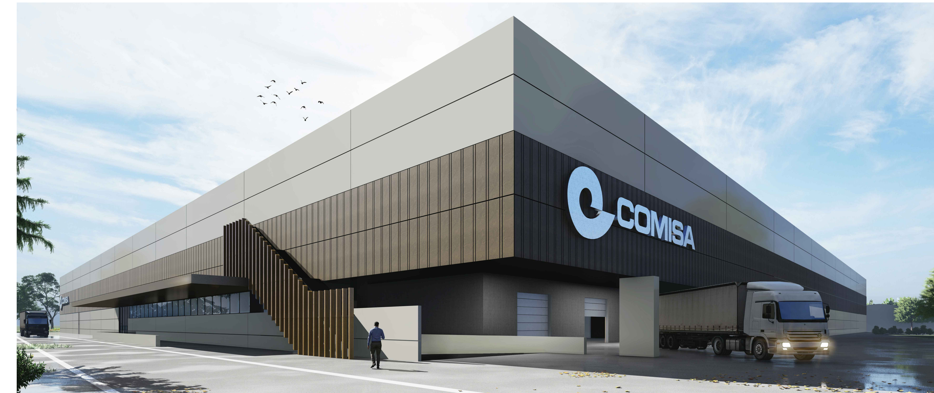
3. VISTA DA SUD-EST DELLO STABILIMENTO