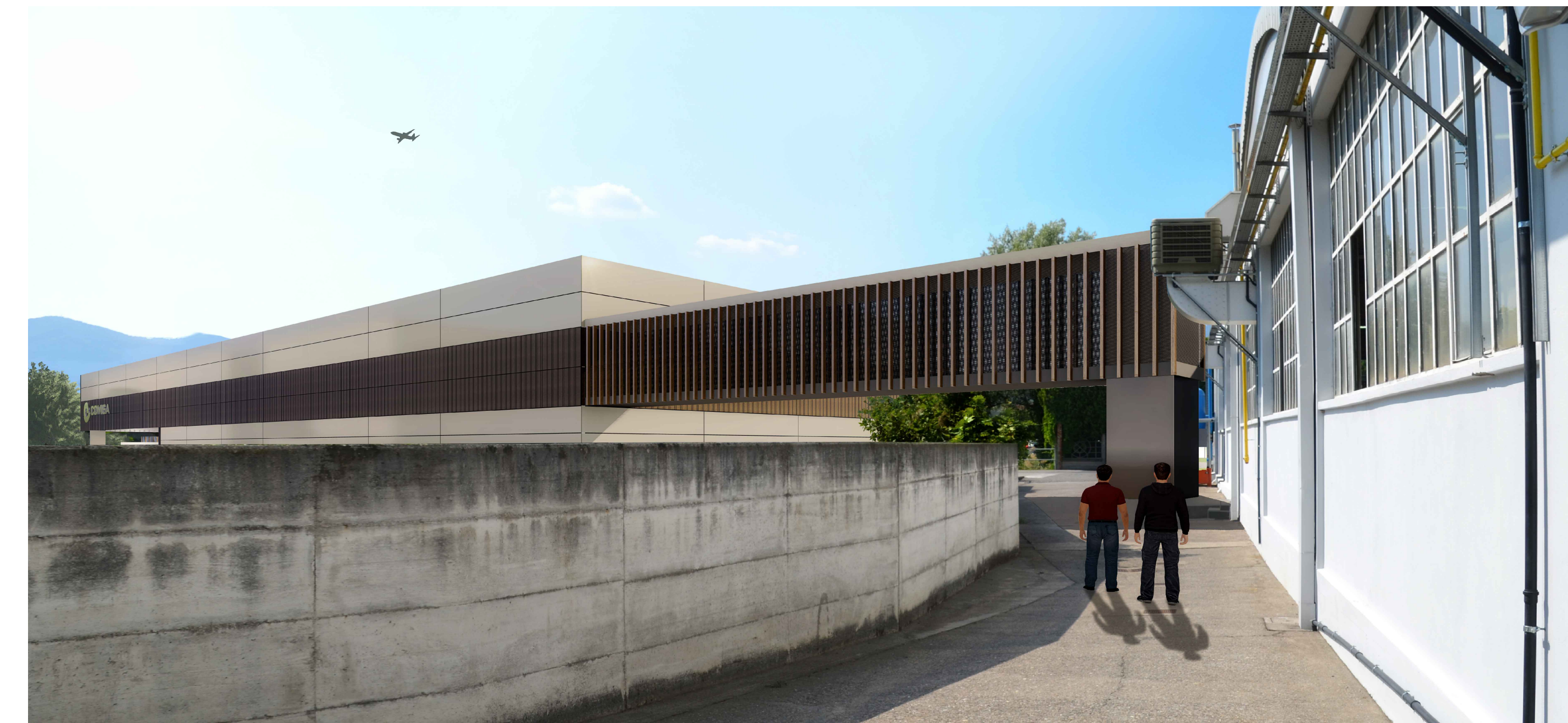
1 VISTA DA STABILIMENTO IN COSTA VOLPINO