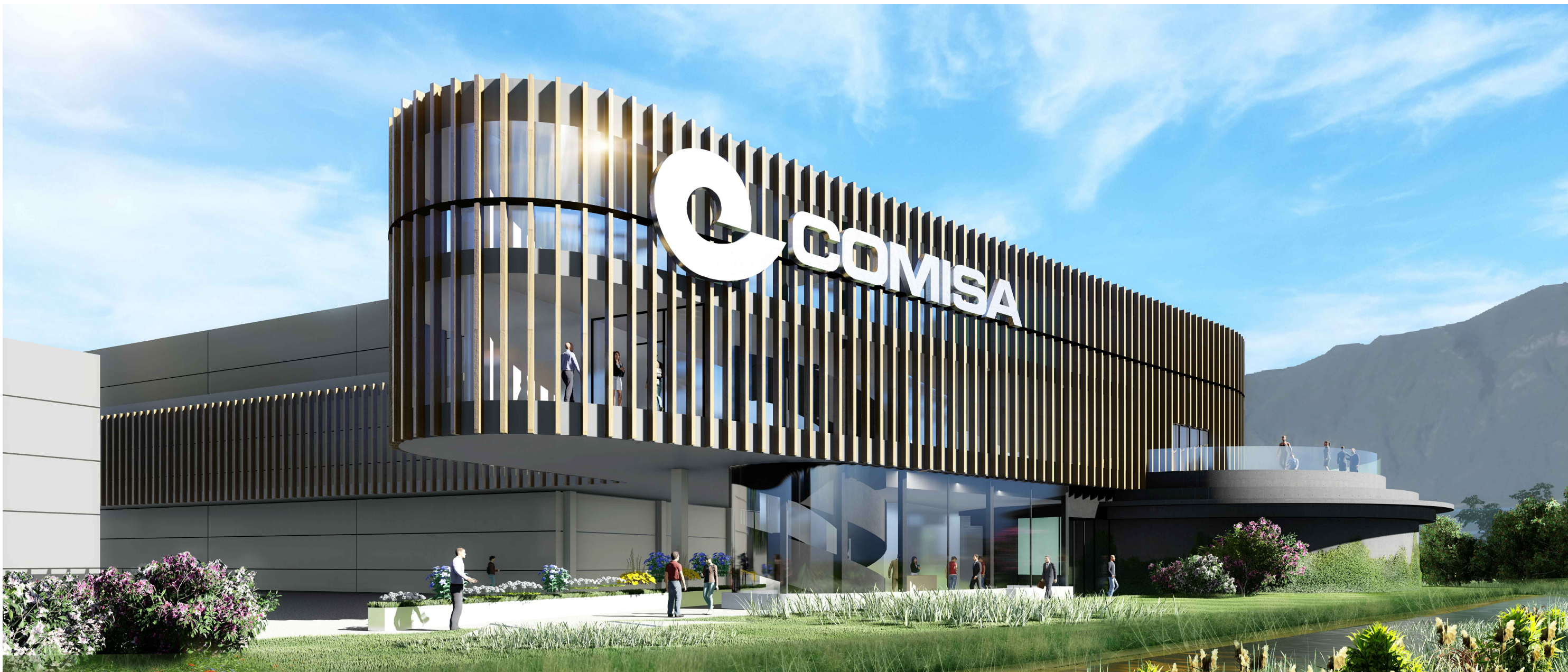
4. VISTA DA NORD DELLA ZONA UFFICI