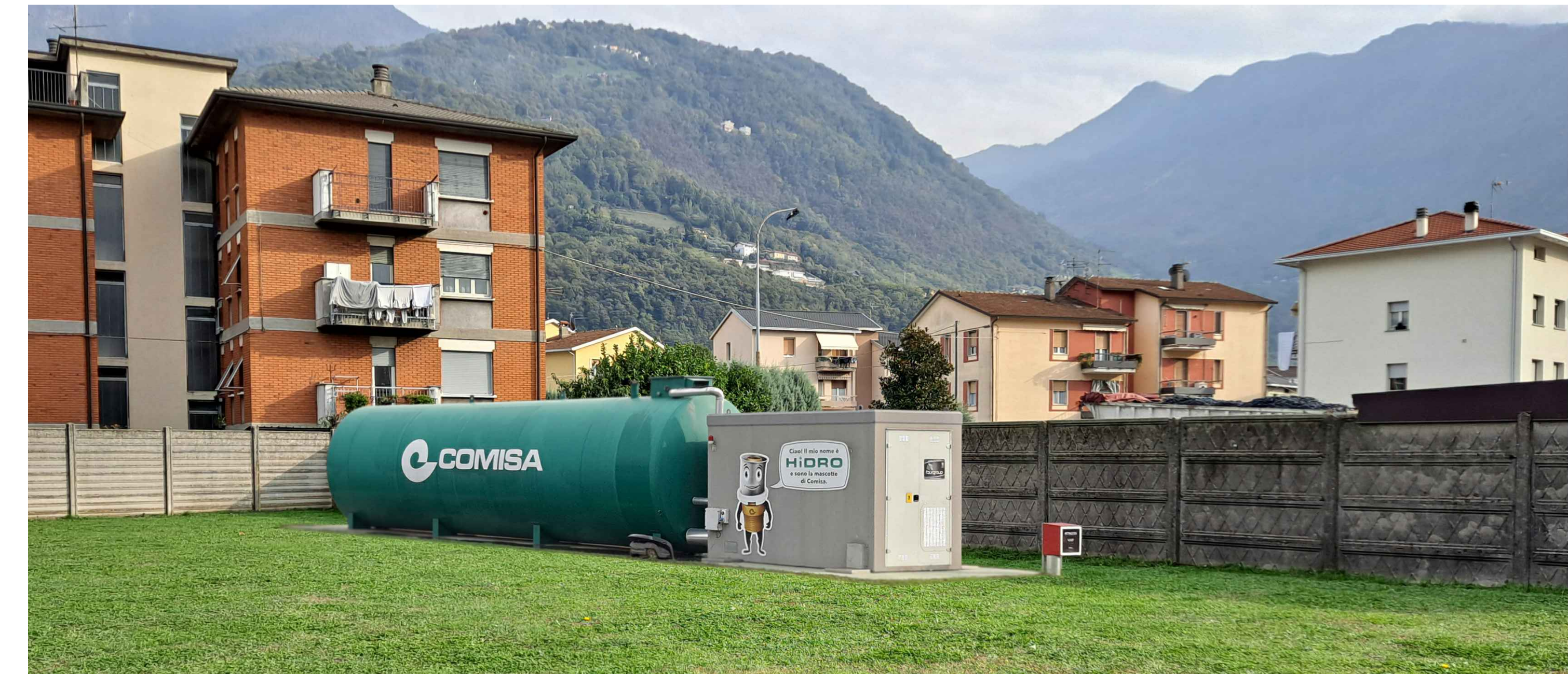
2. VISTA DELLA CISTERNA