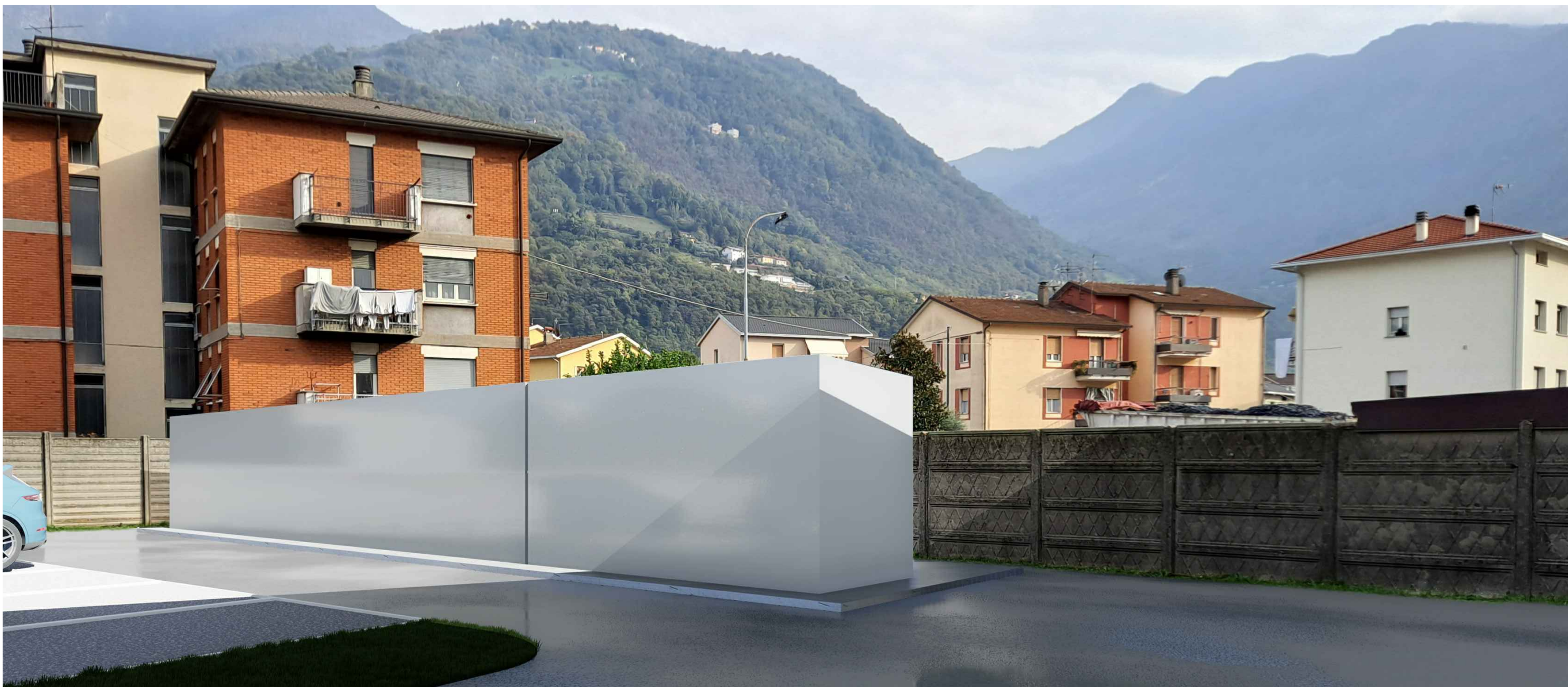
2. VISTA DELLA CISTERNA