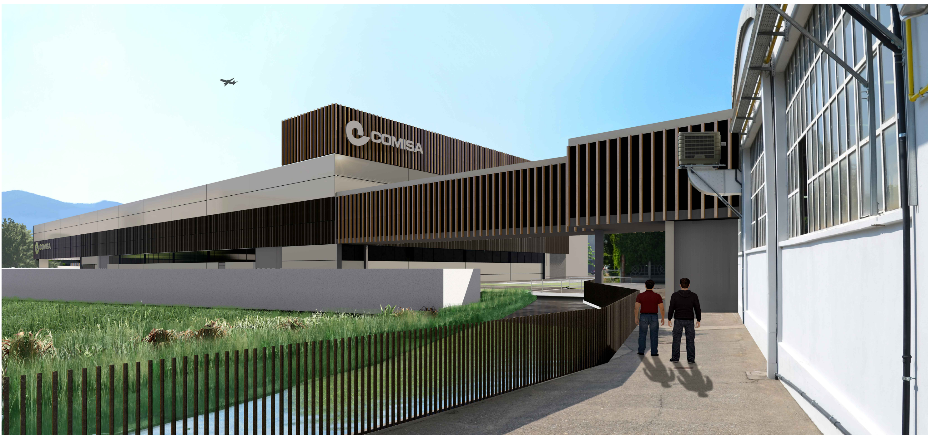
1. VISTA DA STABILIMENTO IN COSTA VOLPINO